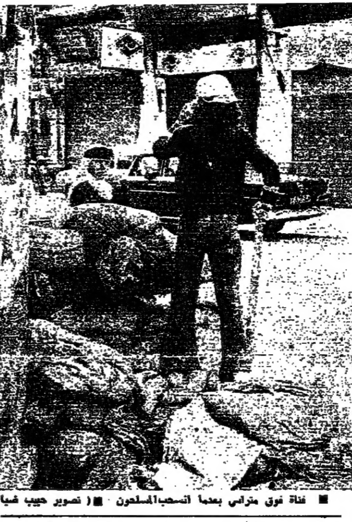
قناة نون مرابي بعدما انسحب المسلمون